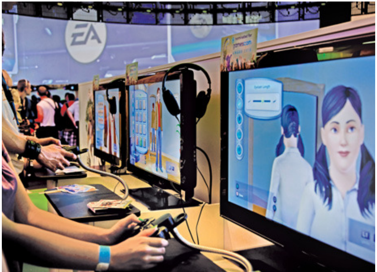
Eine Mischung aus Unterhaltung und nützlichen Funktionen ist konstituierend für computerbasierte Lernspiele. Wie ernst oder wie spielerisch Edutainment sein darf oder sollte, hängt von vielen Faktoren ab. Foto: Vorwiegend Messebesucherinnen spielten auf der Gamescom 2010 die neue Version von „Die Sims“.

W eiterbildung ist zentraler Bestandteil der Personalentwicklung, und lernende Unternehmen sind eine Grundlage für Innovationsfähigkeit – beides ist kaum umstritten, und dennoch bleiben Präsenz- und E-Learning-Kurse für viele Mitarbeiter eine lästige Pflicht. Zehn bis 13 Jahre Schule haben bei vielen Arbeitnehmern den Eindruck verfestigt, dass Lernen stets mit unangenehmer zusätzlicher Arbeit verbunden ist und selten Freude macht. Deutlich angenehmere Erinnerungen sind hingegen mit Erlebnissen außerhalb der Schule verbunden – Spielen war zweckfrei, hatte mehr Freiheitsgrade und machte mehr Spaß. An diese Erfahrungen knüpfen neue Lernanwendungen an, die als Serious Games Lernen und Spiel miteinander verbinden (vgl. Abb. 1).