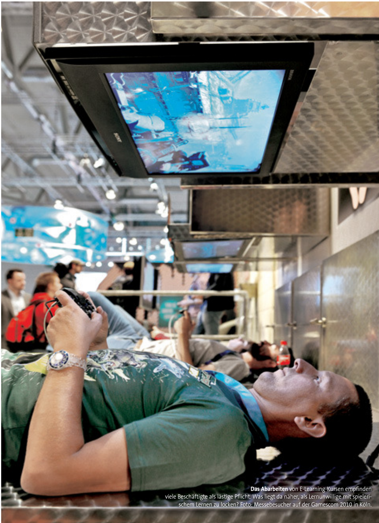
Das Abarbeiten von E-Learning-Kursen empfinden viele Beschäftigte als lästige Pflicht. Was liegt da näher, als Lernunwillige mit spielerischem Lernen zu locken? Foto: Messebesucher auf der Gamescom 2010 in Köln.