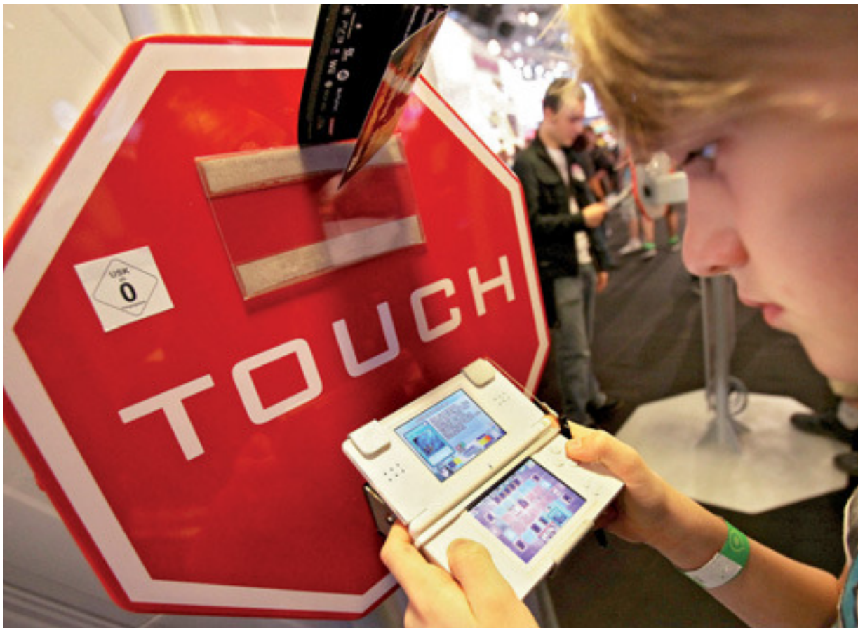
Handfeste empirische Daten zu Lernerfolgen beim ‚ernsthaften Spielen‘ fehlen bislang. Viele Positionen berufen sich auf Vermutungen oder Plausibilität. Foto: Ein Besucher der Gamescom probiert ein neues Spiel aus.

ist der spielerische Rahmen ungezwungener als beispielsweise bei einem Blended-Learning-Seminar (vgl. Abb. 2).